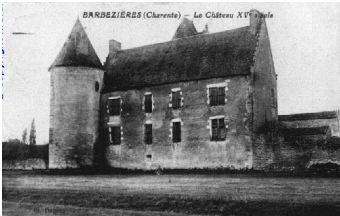
Château de Barbezières